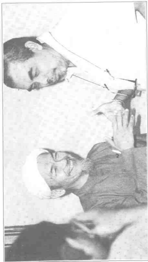
Menteri Besar Kelantan, yang juga Ketua Dewan Ulama PAS dan Mursyidul Am PAS, Tuan Guru Nik Abdul Aziz Nik Mat sentiasa menghulur salam persahabatan dengan sesiapa saja. Kestabilan politik Kelantan banyak bergantung kepadanya. Semoga Hudud dapat dilaksanakan di Kelantan secepat mungkin dan keadilan Islam dapat dinikmati, bukan setakat dibaca sahaja.