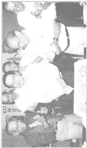
Lagi seorang pemimpin pembangkang yang digeruni Mahathir dan Anwar, iaitu Ketua Pembangkang, Lim Kit Siang. Setelah terbukti keberkesannya selama 25 tahun di Parlimen, mungkin tiba giliran menjadi Ketua Menteri Pulau Pinang.