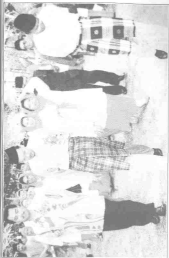
Mungkin ini gandingan yang lebih sesuai, Anwar bersama Muhyiddin?