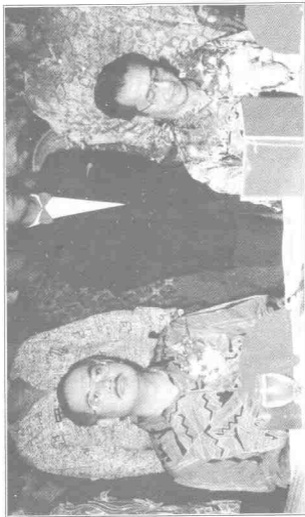
Jangan sangka Najib tidak berpeluang menjadi PM selepas Mahathir berundur nanti. Najib pun tahu hubungannya dengan Anwar tidak semesra dulu, jadi rapat-rapatlah dengan Mahathir. Tuah avam nampak di kaki, tuah Najib di mana pula?