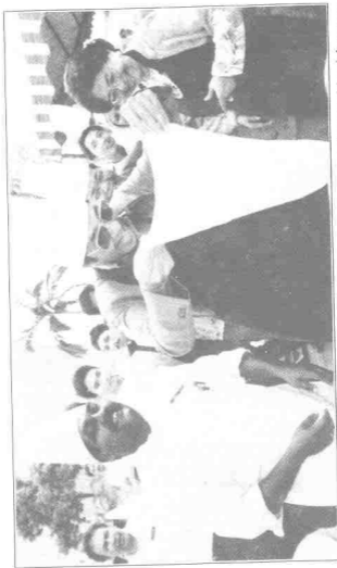
Ajii ... Mahathir dah jadi mamak roti canai. Tok Mat pun tumpang seronok sama. Masalah negara sudah banyak diserahkan kepada Anwar. Mahathir mahu enjoy sekarang. Silap-silap enjoy menvesal seumur hidup nanti!