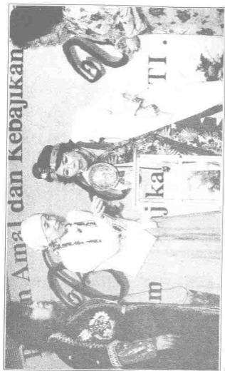
Ramai teman-teman yang agak terkilan melihat gambar isteri Anwar, Dr Wan Azizah berpakaian begini ... di depan Mahathir pula tu. Mereka sedang mengusik penonton dengan aksi meniru pertuturan Lee Kim Sai, Samy Vellu, Sanusi Junid dan Lim Keng Yaik.